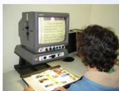
Análise gráfica de relevos