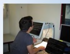
Software adaptado (voz)